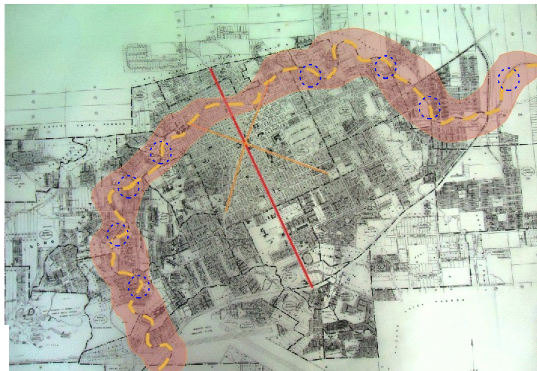
Fig.56-Esquema Analítico percurso do trem pela malha urbana de Erechim e possíveis paradas para o ônibus sobre trilhos.